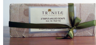
株式会社ファラビ様で取り扱われている自然派コスメ

知識も豊富だったので非常に安心感が持てました。お願いしたい内容に合わせて得意分野の方が集まってくれるので心強いですね。